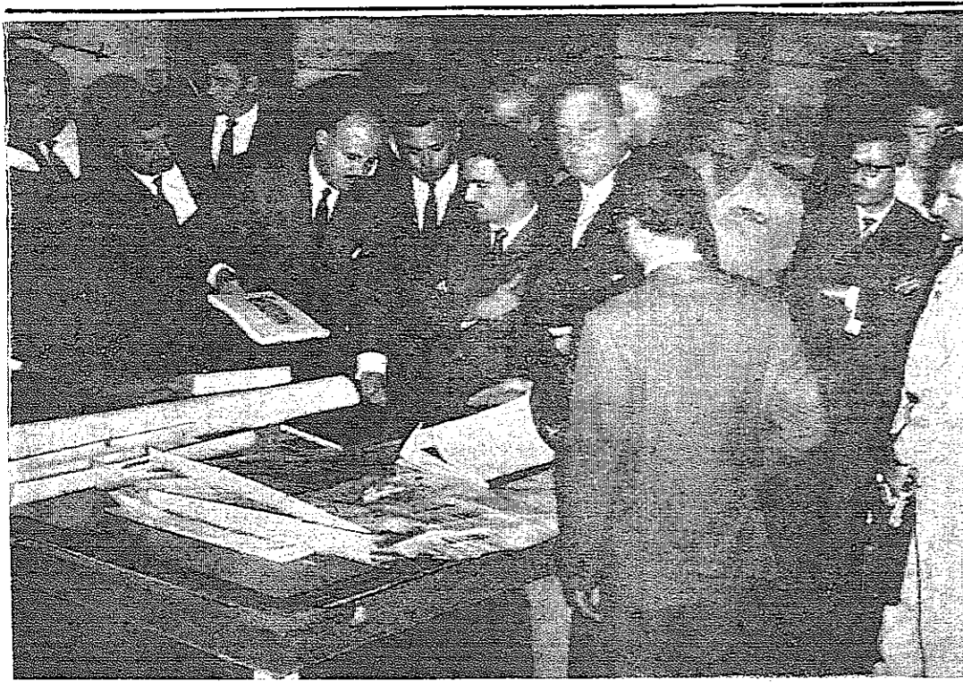
سمو الامير حسن نائب جلالة الملك والي العهد العظيم يستمع الى الايضاحات السيد احمد فوزي أمين العاصمة حول مشاريع الامانة